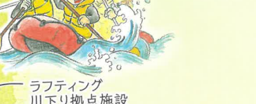
ラフティング川下り拠点施設